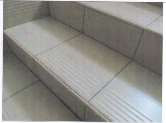
Фото №20 - Внутренние лестницы