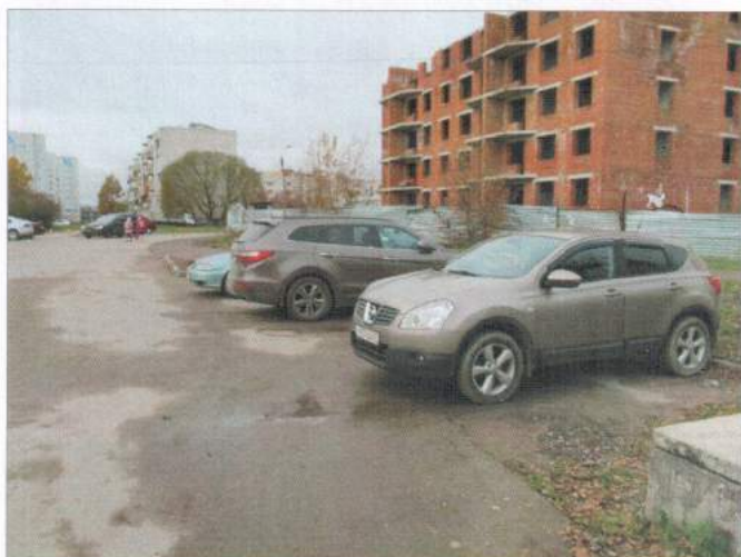
Фото №1 – Автостоянка.