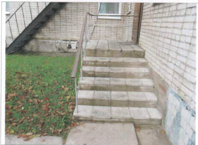
Фото №11 – Наружная лестница (отдельного входа в группу)