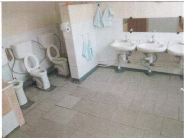
Фото №25 – Санитарно-гигиеническое помещение