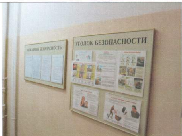
Фото №27 – Система информации