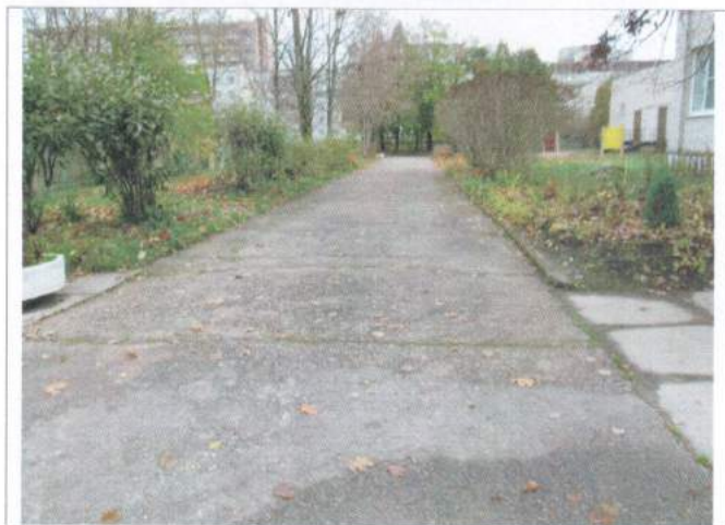
Фото №4 – Прилегающая территория