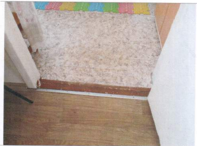
Фото №17 – Внутренние двери