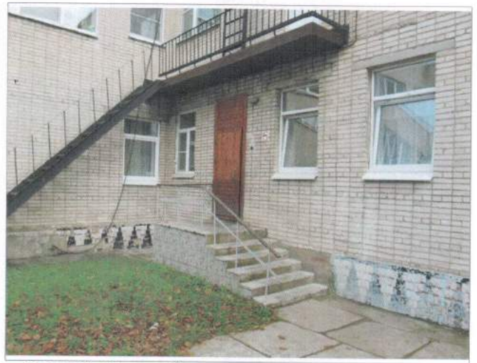
Фото №10 – Отдельный вход в группу расположенную на первом этаже