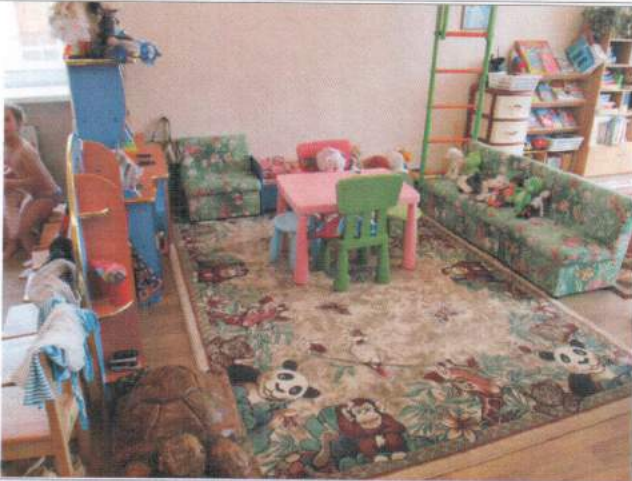
Фото №21 – Зона целевого назначения здания (целевого посещения объекта)