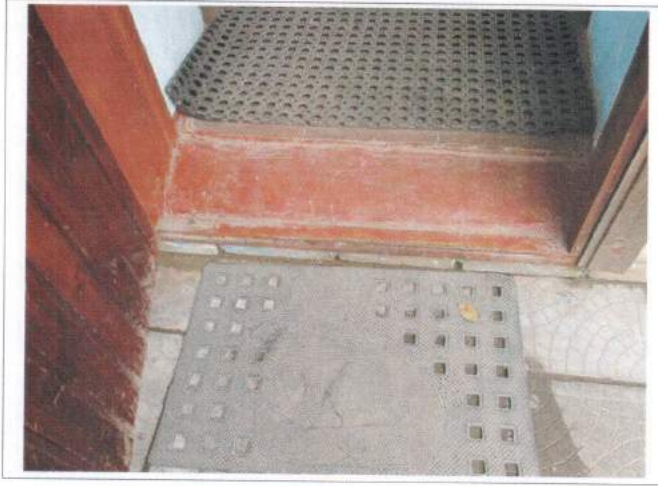
Фото №13 – Наружная входная дверь (отдельного входа в группу)