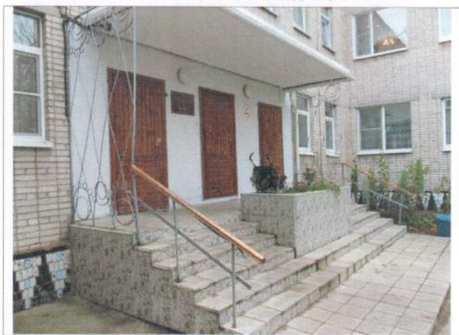
Фото №6 – Наружная лестница главного входа