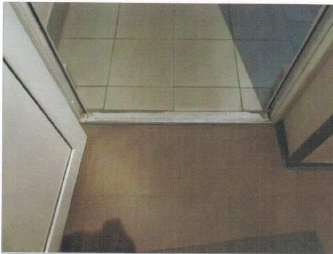
Фото №9 — Внутренняя входная дверь