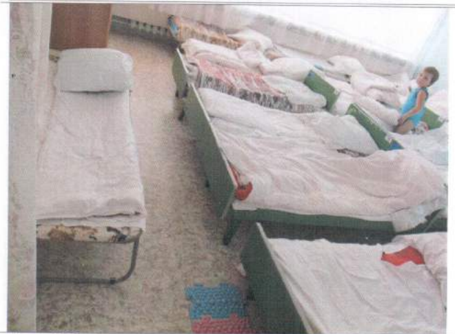
Фото №22 – Зона целевого назначения здания (целевого посещения объекта)