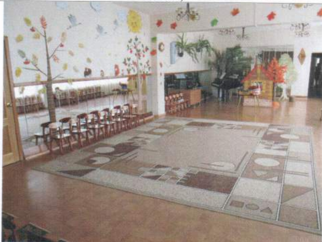
Фото №23 – Зона целевого назначения здания (целевого посещения объекта)