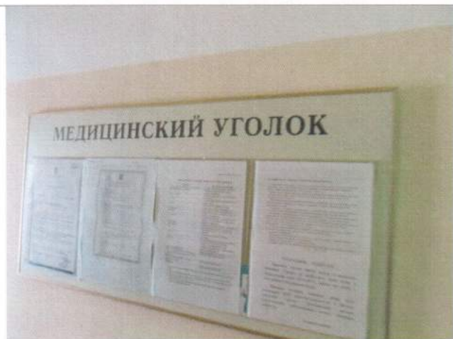
Фото №29 – Система информации