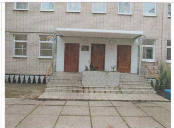
Фото №5 – Входная площадка главного входа