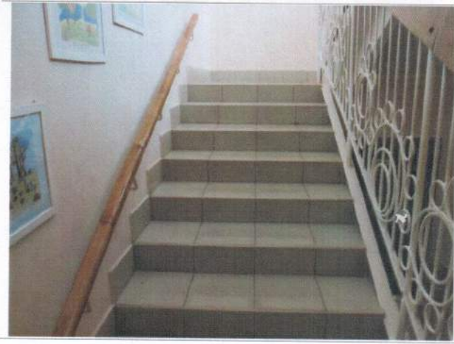
Фото №19 – Внутренние лестницы