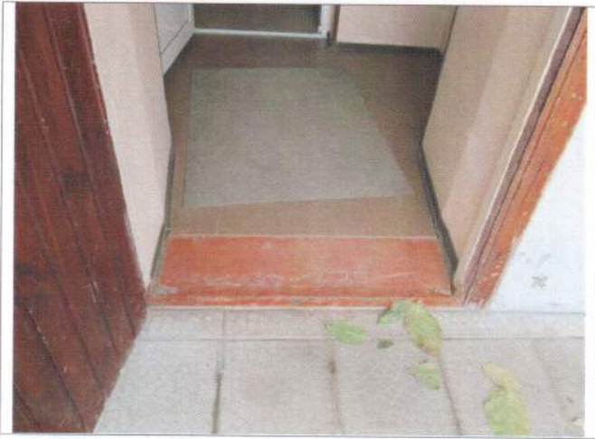
Фото №7 – Наружная входная дверь