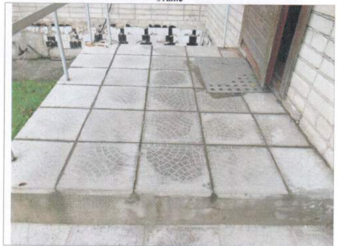
Фото №12 – Входная площадка (отдельного входа в группу)