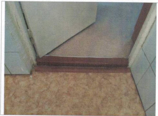
Фото №15 – Внутренние двери