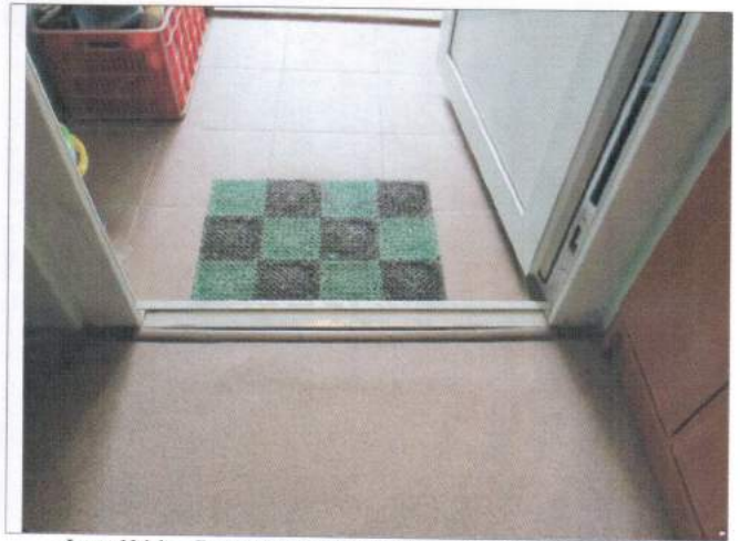
Фото №14 – Внутренняя входная дверь (отдельного входа в группу)