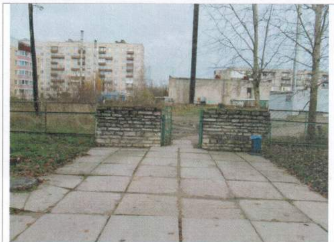
Фото №3 – Вход на прилегающую территорию