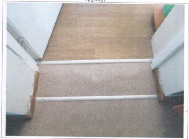
Фото №16 – Внутренние двери