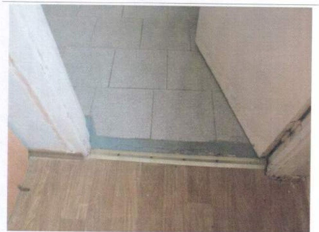
Фото №18 – Внутренние двери