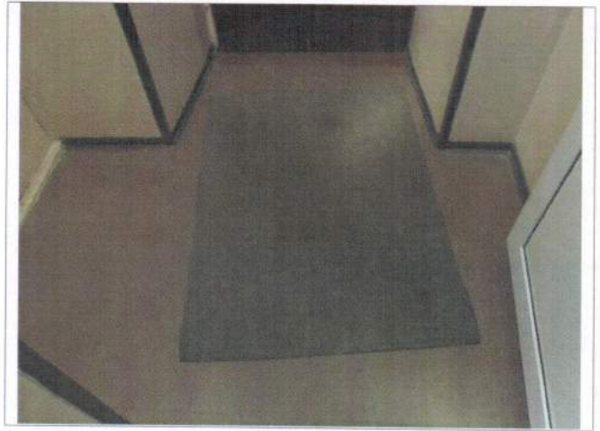
Фото №8 - Тамбур