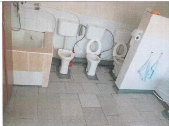
Фото №26 – Санитарно-гигиеническое помещение