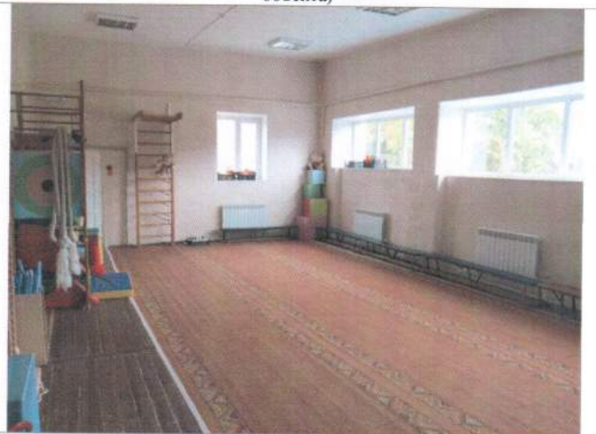
Фото №24 – Зона целевого назначения здания (целевого посещения объекта)