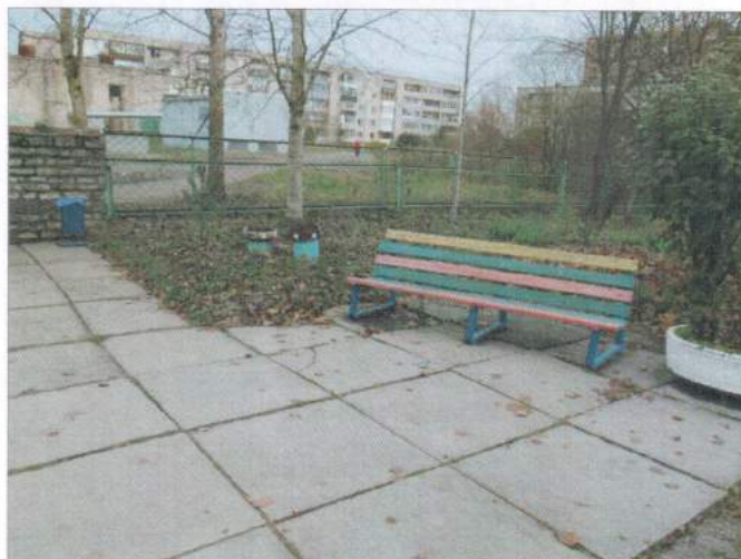
Фото №2 – Места отдыха